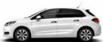
BLANC NACRÉ (N)