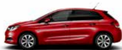
ROUGE BABYLONE (N)