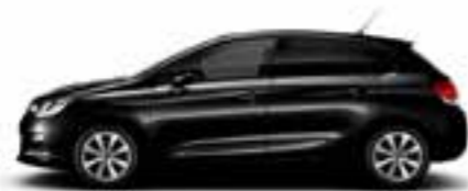
NOIR PERLA NERA (N)