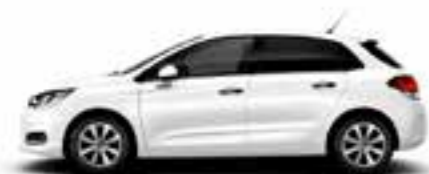
BLANC BANQUISE (O)