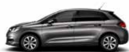
GRIS PLATINIUM (M)