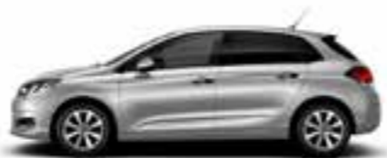
GRIS ALUMINIUM (M)