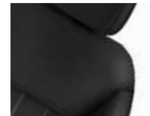
TISSU PONTY MISTRAL