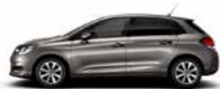
GRIS GALET (N)