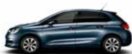
BLEU BOURRASQUE (M)