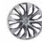
ENJOLIVEURS 16" ATLANTA