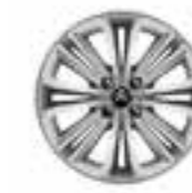
JANTE ALLIAGE 16" DARWIN